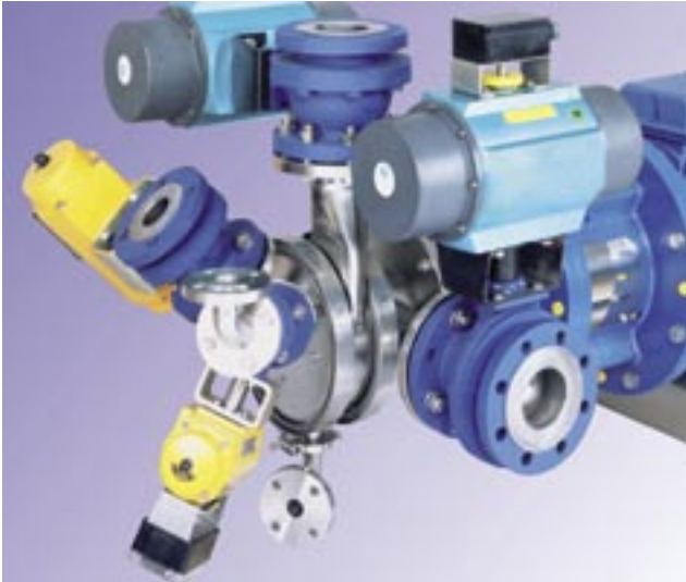
Conti-TDS-Mischkopf mit Flüssigein- und -auslass sowie Pulvereinlässen.

vor er erstarrt oder vernetzt: durch Eindispersieren in die flüssige Phase. Besonders anspruchsvoll sind dabei Aufgabenstellungen, bei denen Pulver intensiv dispergiert werden müssen, bestimmte Maximaltemperaturen jedoch nicht überschritten werden dürfen, weil sonst die Vernetzung bereits im Produktionsbehälter startet (Plastisole, Organosole). Interessant ist auch der Eintrag von Leitfähigkeitsrußen, bei denen ein einziges Kilogramm Pulver eine spezifische Oberfläche von fast einer Million Quadratmetern hat. Diese Oberfläche muss in Bruchteilen von Sekunden vollständig benetzt sein.