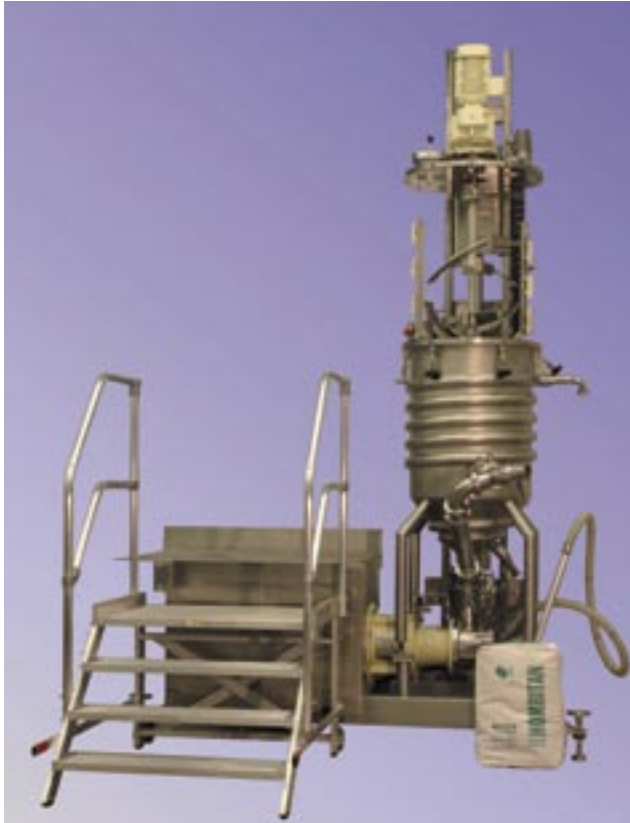
Conti-TDS-Anlage zur Herstellung von hochviskosen Produkten.

dichte hochdisperser Kieselsäuren extrem niedrig ist, ist das anfallende Staubvolumen sehr groß.